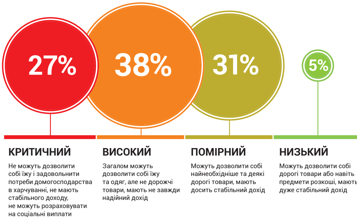
Рисунок 1: Розподіл респонденток на групи за рівнем ризику економічної вразливості